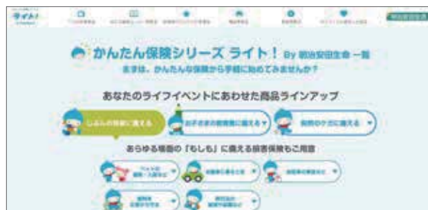
当社公式ホームページ「かんたん保険シリーズ ライト! By 明治安田生命」

リンクコーディネーター等(営業職員)・「明治安田のほけんショップ」「ほけん相談窓口」の担当者等による対面・非対面でのコンサルティングを案内する取組みも展開しています。今後もテクノロジーの進化に応じた各種コンテンツの拡充や、お手続きの取扱範囲拡大等、お客様の利便性向上や理解促進に資する取組みを進めていきます。