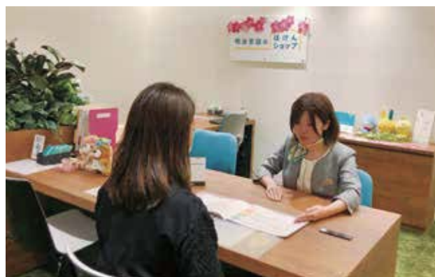
明治安田のほけんショップ 船橋

今後も来店型店舗を通じて多様なお客様のニーズにお応えし、さらなるお客様サービスの拡充に努めていきます。