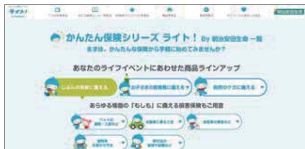
当社公式ホームページ「かんたん保険シリーズ ライト! By 明治安田生命」

リンクコーディネーター等(営業職員)・「明治安田のほけんショップ」「ほけん相談窓口」の担当者等による対面・非対面でのコンサルティングを案内する取組みも展開しています。今後もテクノロジーの進化に応じた各種コンテンツの拡充や、お手続きの取扱範囲拡大等、お客様の利便性向上や理解促進に資する取組みを進めていきます。