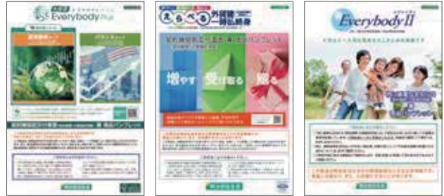
外貨建一時払終身保険 「外貨建・エブリバディプラス (運用重視タイプ・バランス タイプ)」パンフレット 外貨建一時払終身保険 「えらべる外貨建 一時払終身」 パンフレット 円建一時払終身保険 「エブリバディII」 パンフレット