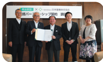
包括パートナーシップ契約 調印式