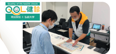
丸の内本社・体験会の様子