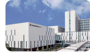
国立循環器病研究センター