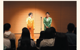
笑って健活!お笑いライブ