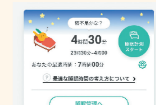
「MYほけんアプリ」睡眠サポート機能

睡眠の時間や深浅等を計測、質を可視化したうえで、睡眠の質の向上に向けた気付きを提供しています