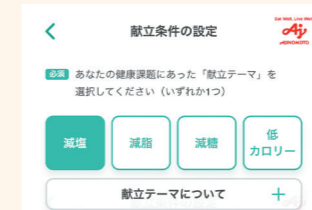
「MYほけんアプリ」健康献立by味の素(株)

健康課題に応じた献立テーマと使用したい食材を選択することで、1万種類のレシピを組み合わせ、パーソナライズ化した献立をご提案します