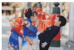
2021年 グランプリ作品