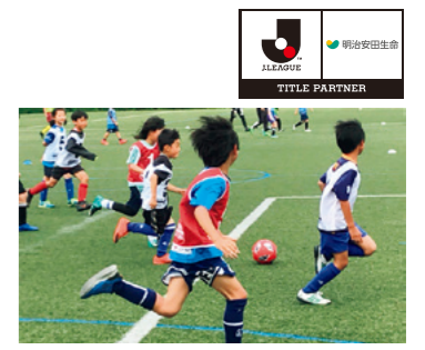
小学生向けサッカー教室の様子（神奈川マーケット開発部）

地元のJクラブ等のみなさまの全面協力を得て、2019シーズンは、小学生を対象にしたサッカー教室を9月末までに全国で68回開催し、約3,700人のお子さまや保護者の方々に参加いただきました。あわせて、地元Jクラブやパートナー企業のご協力のもと、Jリーグ選手OBの講演会等のイベントも開催しています。