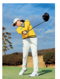
プロゴルファーの勝みなみ選手