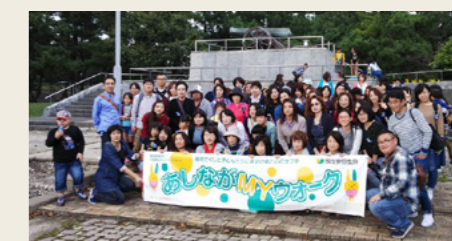
あしながチャリティー&ウォークの様子(鳥取)

あしなが育英会ご協力のもと、2011年度からスタートした「あしながチャリティー&ウォーク」は2017年度は従業員とその家族等約4万1千人が全国73箇所で開催されました。2018年度は全国75箇所で開催予定です。今後も本活動を通じて、親をなくした子どもたちの進学と心のケア支援に加え、従業員の健康増進に努めてまいります。