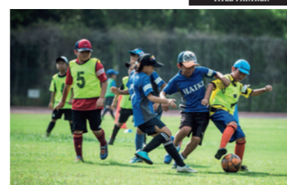
小学生向けサッカー教室の様子(長崎支社)