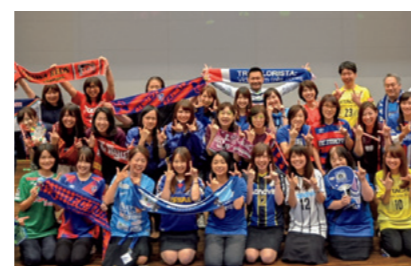
「明治安田生命Jリーグ女子倶楽部」の活動の様子

試合観戦だけでなく、サッカーへの興味・関心を高め応援の輪を広げていくために、さまざまな活動に取り組んでいます。