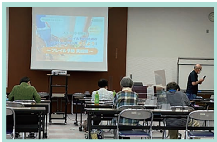
フレイル予防講座の様子