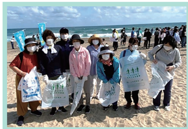
海岸清掃活動の様子