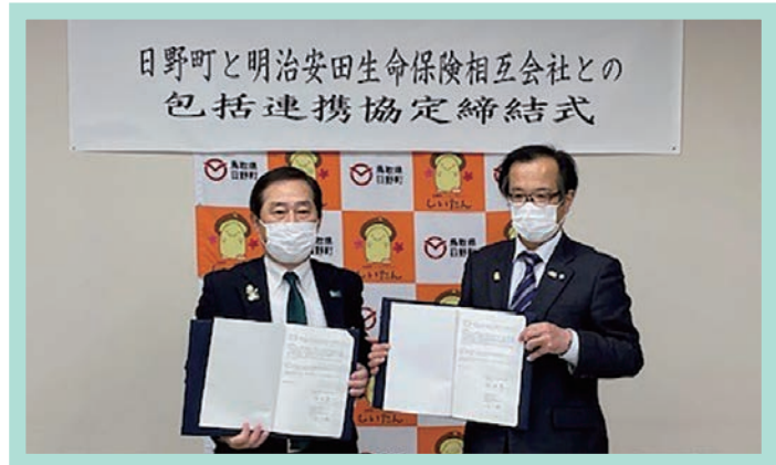
日野町との締結式の様子