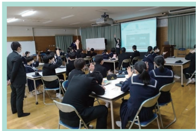
中学校での金融・保険教育の様子