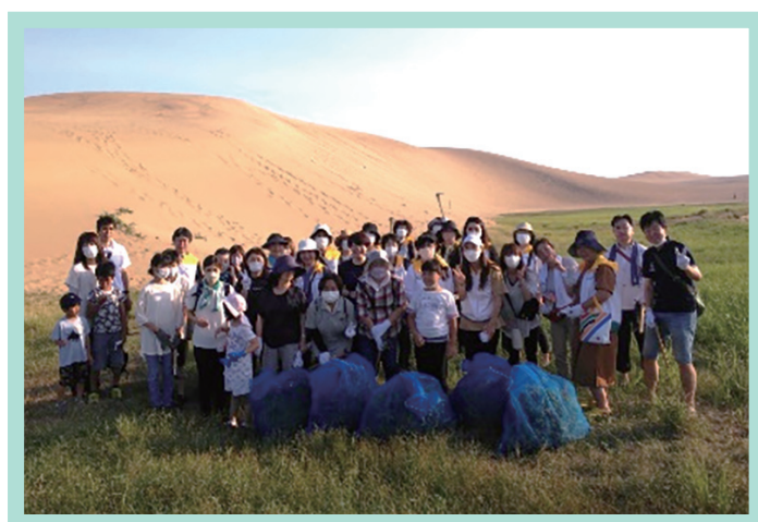
鳥取砂丘除草活動の様子