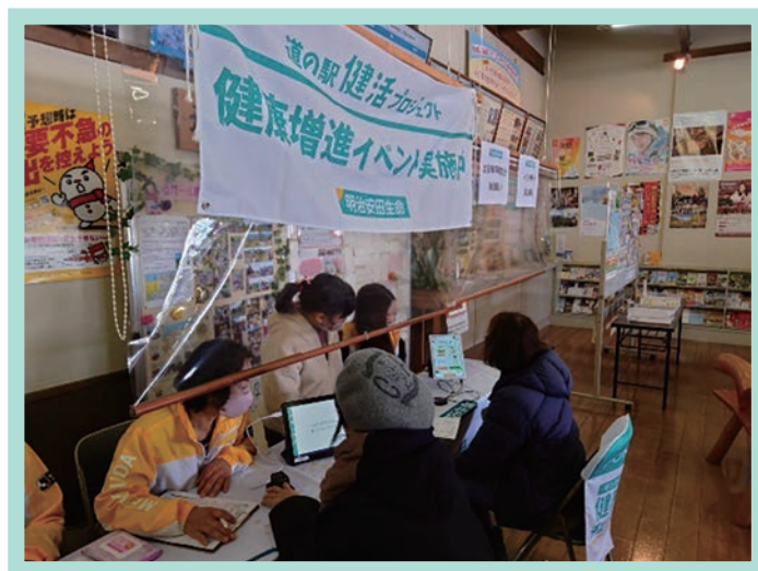
道の駅イベントの様子