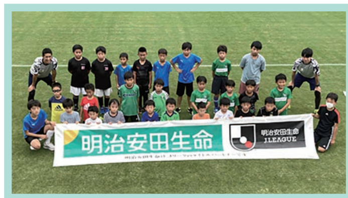
サッカー教室の様子