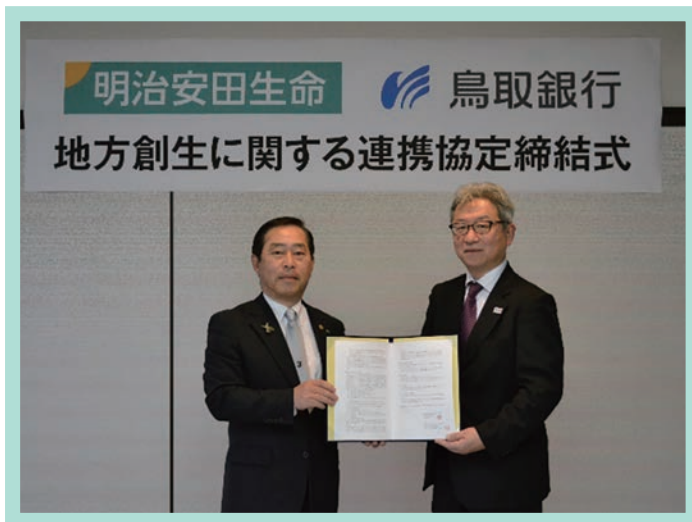
鳥取銀行との締結式の様子