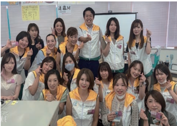
ピンクの日活動（羽村営業所）