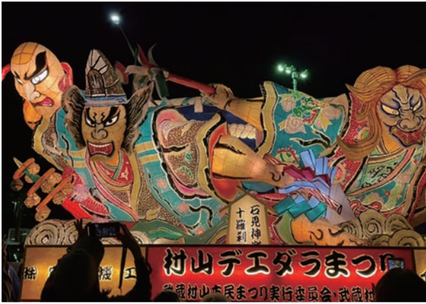
マツダエダラまつり（武蔵村山市）