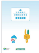
重要事項説明ファイル

新契約締結時にお客さまにお渡しする重要事項説明ファイルを石灰石を原料としたLIMEX(ライメックス)素材に切り替えるとともに、紙製クリアファイルを導入し、脱プラスチックに向けた取組みを推進しています。