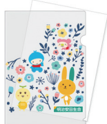
紙製クリアファイル